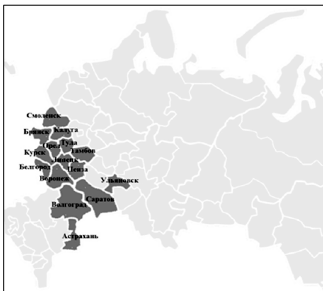
Рис. 1. “Красный пояс” РФ в 1990-е гг.

Какие регионы входят в русский “библейский пояс”? Это регионы Центральной России, отчасти – Южной России и Поволжья, с высокой долей приверженцев православия. Важно подчеркнуть, что ранее эти регионы входили в “красный пояс” России (см. рис. 1). Попытаемся ответить на вопрос, насколько случайным могло бы быть такое совпадение.